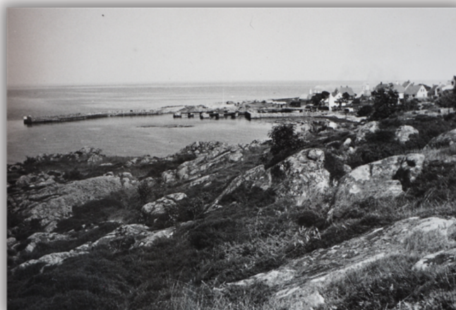
Udsigten fra Bokul over Norresân