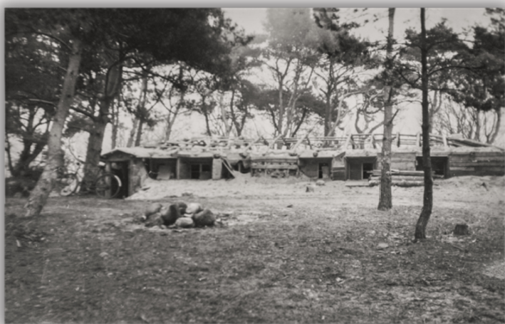
Russerlejr i Stampen

En anden ung pige oplevede også, at russerne ikke respekterede den private ejendom, da hun var alene i sit hjem med to tjenestepiger. Tre russiske officerer, herunder kommandanten for Robbedale-lejren, brød ind i hjemmet, gik ind i stuen og satte sig i stolene, hvor de åbnede øl fra en medbragt ølkasse. Pigen, som må have været skrækslagen over pludselig mod sin vilje at have tre fremmede russiske mænd i sit hjem, som hun ikke kunne forstå eller tale med, ringede først til den russiske tolk på Dams Hotel, der forsøgte at tale de russiske mænd til rette, dog uden held. Pigen ringede derefter til en mand på en nærliggende gård, for at få at vide, hvad hun skulle gøre. Manden hjalp hende ved at ringe til Transportkolonnen, men da den ankom, var russerne forsvundet fra hjemmet. Episoden efterlader os med ubesvarede spørgsmål – fx hvad russernes hensigt med at bryde ind i hjemmet var? Desværre finder vi nok ikke svarene. De få detaljer vi har, er nedskrevet i modstandsbevægelsens rapporter.