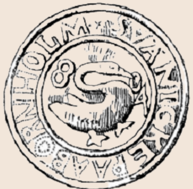
Seglaftryk af Svaneke's nye bysegl 1584. Byforeningen Svaneke's Venner bruger seglaftrykket som logo. Gengivet her med tilladelse fra Svaneke's Venner.

"Alt I alt deltog ikke færre end 54 bornholmere ved hyldningen og festlighederne i Lund den 20. juli 1584. Til stede ved festlighederne i Lund var også flere samtidige berømtheder, heriblandt astronomen Thycho Brahe."