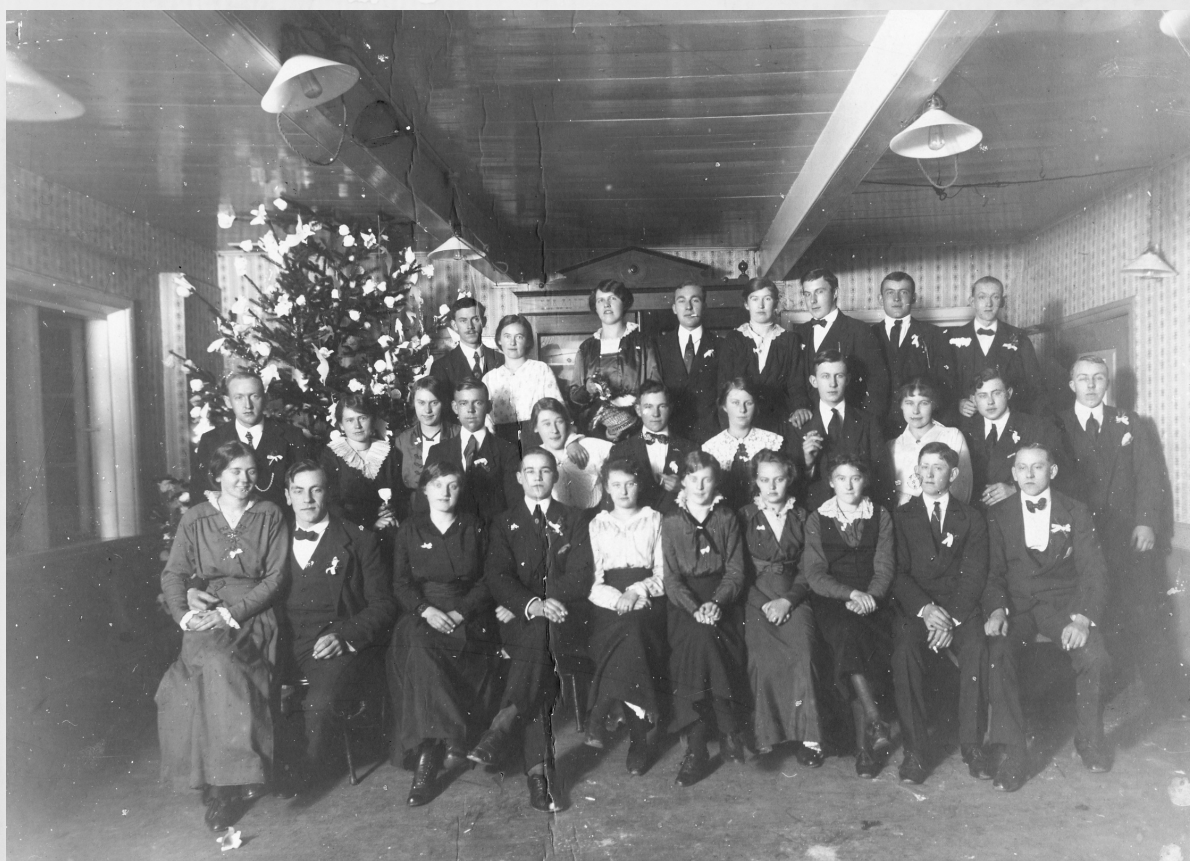
Fig. 2: Julebal på Jantzens hotel i 1918, Gudhjem museum.

julelodtrækning om "presenter" og "Et stort Kæmpe-Juletræ med flere hundrede Lys" . Gevinsterne til julelodtrækningen var ikke i den billige ende og talte blandt andet et sølvherreur og forskelligt sølvtøj, hovedgevinsten var sammen med den sidste present "hele det pyntede juletræ" . At vinde det fuldt pyntede træ skal forstås ud fra at hovedparten af pynten på den tid var spiselig pynt, det var således ikke guirlander og papirklip man vandt, men chokolader, kager, marcipan- og sukkerfigurer. Det bornholmske borgerskab fandt utvivlsomt også inspiration "ovrefra" . I Bornholms Tidende i julen 1844 fandtes udførlig omtale af Industriforeningens Julebazar i hovedstaden, der havde været besøgt af ikke mindre end 12.300 personer. Der var, ifølge artiklen, alene på en uge "ved Indkjøb til Juletræet, der skeer for Halvdelen af Entrepengene, kommet Boutikleierne circa 1,000 Rbd. Tilgode."