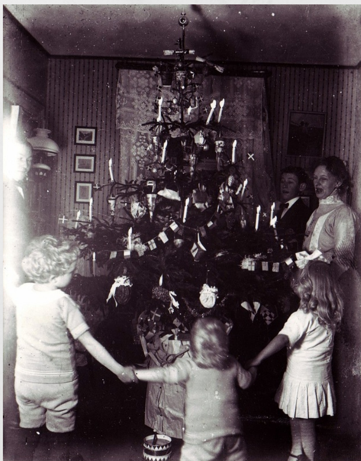
Fig. 1: Juletræ hos familien Gornitzka, juleaften 1914. Fotograf Otto Gornitzka. (BØA 2020-113)

Allerede ved midten af 1800-tallet var juletræet blevet udbredt blandt det bedre borgerskab overalt på øen. Og de allerede kendte julefester og juleballer begyndte at inddrage juletræet som en del af festlighederne. Juletræsfester for byens spidser kunne i 1800-tallet være ledsaget af allehånde fornøjelser som julebazar, teaterstykker og efterfølgende bal. Disse festligheder var typisk for de voksne – eller unge, men der fandtes også de såkaldte ”børneballer” for de mindre.