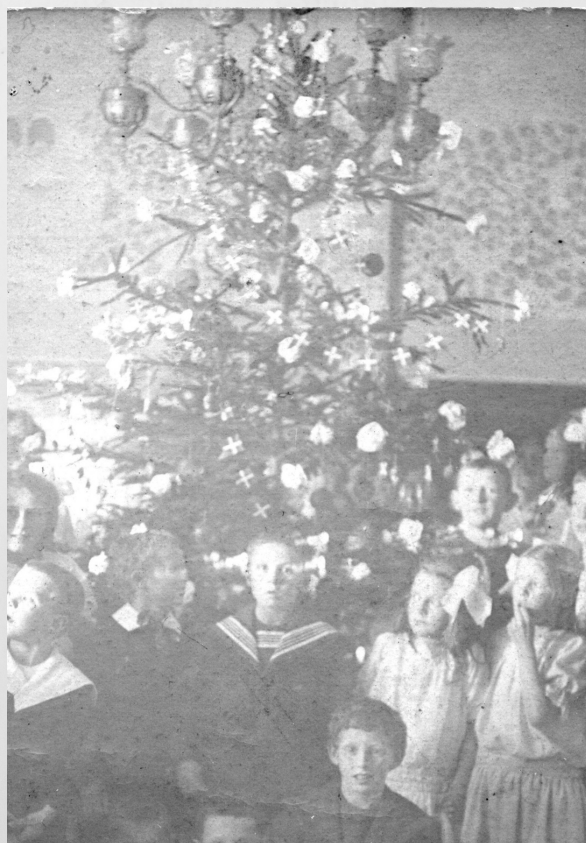
Fig. 6: Juletræsfest i Allinge (BØA 2004-22/1)

Disse foreningsfester for medlemmer af især arbejderklassen politiske foreninger, opstod som et alternativ til overklassens velgørende juletræsfester, men arrangeret af dem selv og for dem selv.