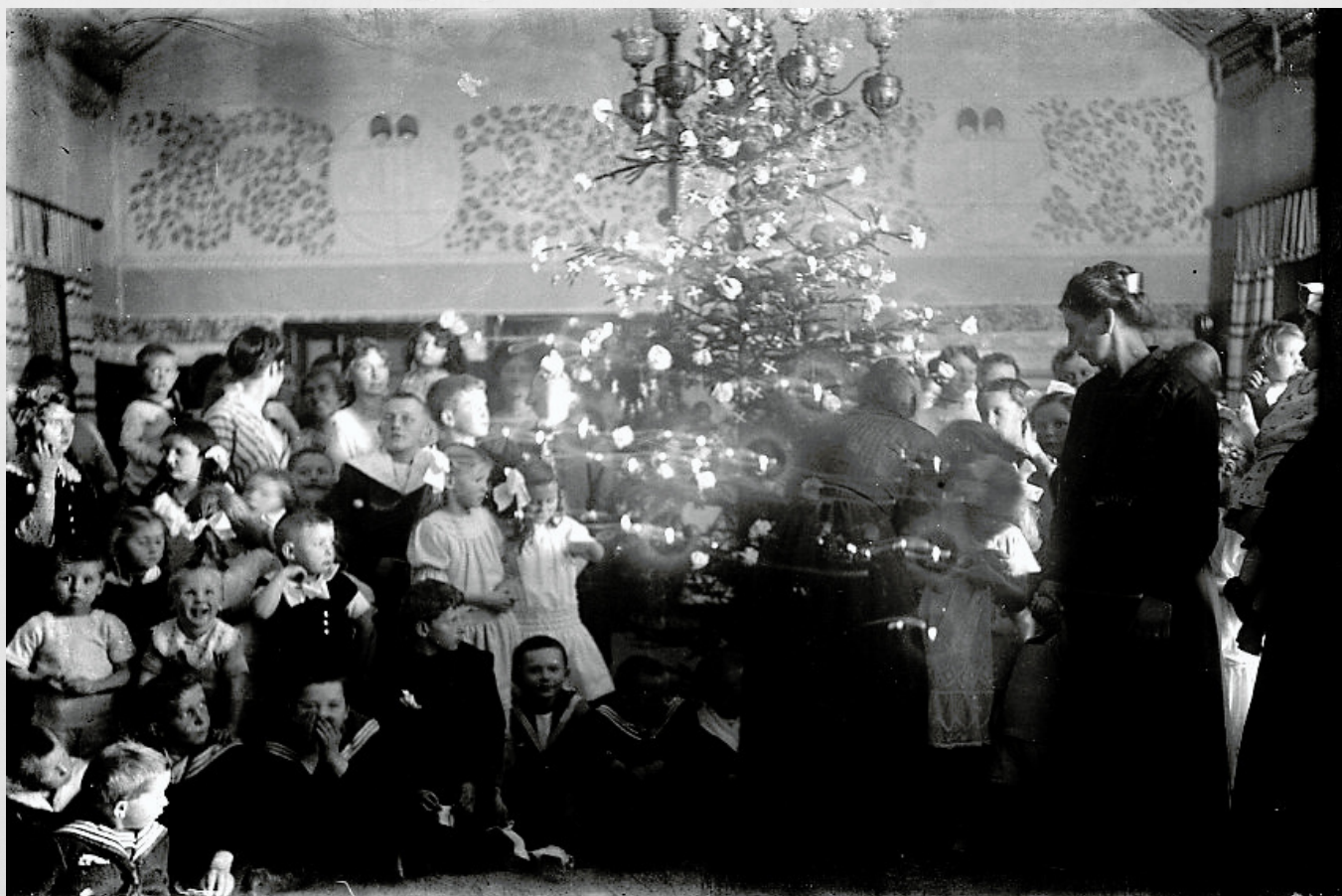
Fig. 5 Juletræsfest for børn i Allinge, måske søndagsskolebørn, foto: Otto Gornitzka (BØA 2020-113)

Kirkerne og søndagsskolerne var blandt dem, der tidligt etablerede juletræsfester for sognets og søndagsskolens børn, og i slutningen af 1800-tallet var julearrangementer uden juletræ blevet et særsyn.