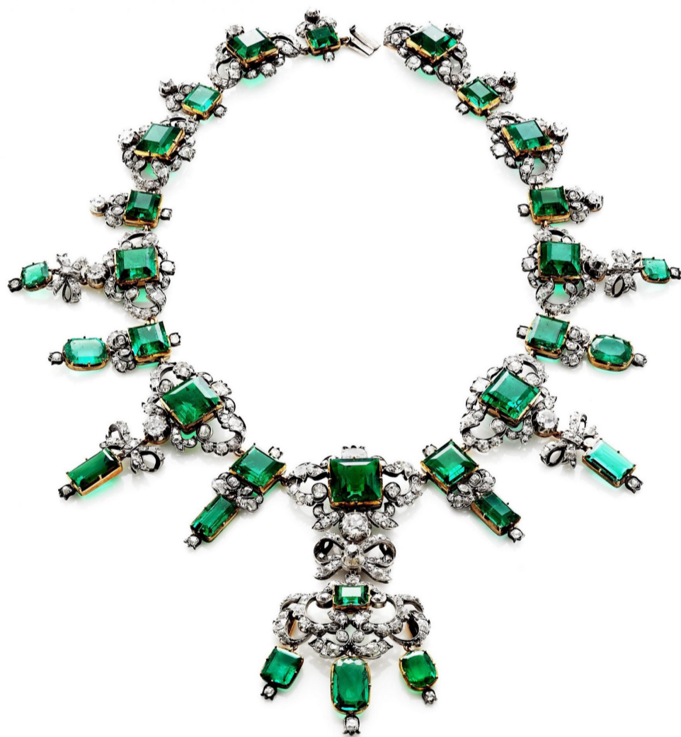
Smaragdsættet. Smaragderne var en barselsgave fra Chr. VI til sin dronning Sophie Magdalene i anledning af fødslen af sønnen Frederik (V). Smaragdsættet indgår nu i kronjuvelerne.

Som i vikingetiden lå der måske endnu en snert af legitimitet og anerkendelse af