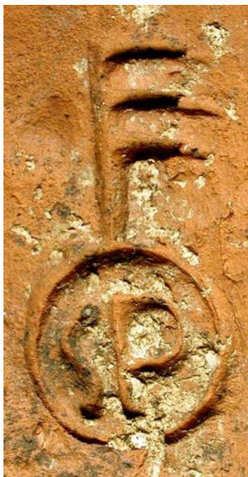
De to teglsten, der blev fundet af museet.