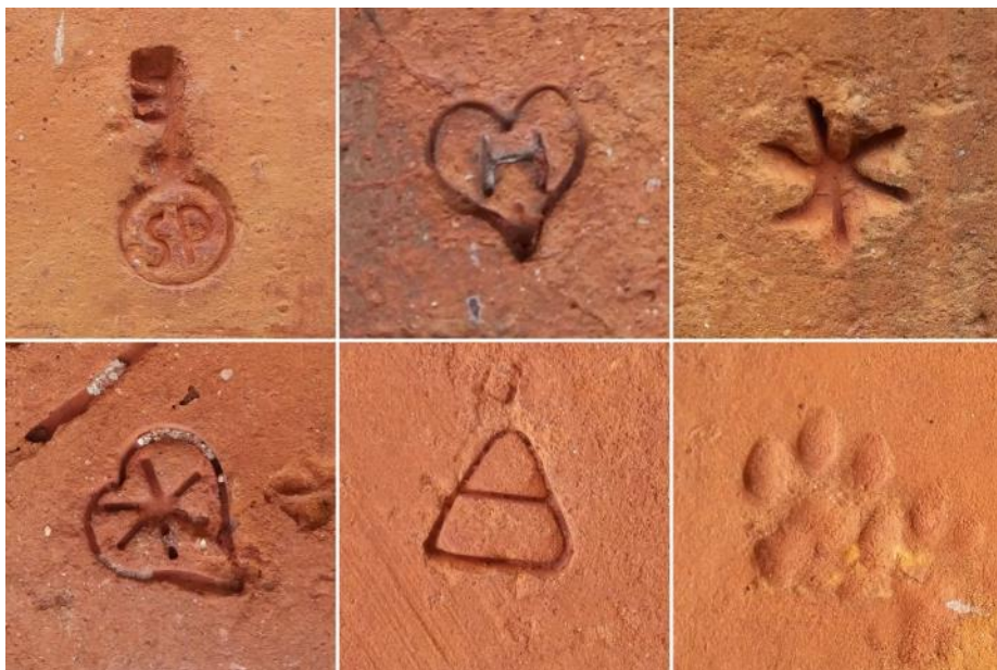
Udvalgte lübeckerstempler fra Kommandantgården i Rønne, samt et dyrefodspor

I 1743 opgives Hammershus, og bornholmerne henter byggesten herfra