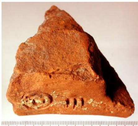
Top-billede: Anton Edvard, 1849 (udsnit) Bornholms Kunstmuseum

en af de teglsten, som Bornholms Museum fandt under udgravningen i 2014. Denne teglsten er nemlig forsynet med et stempel, der i mere end én forstand er en nøgle.